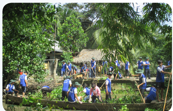
Hơn 100.000 lượt sinh viên tham gia các hoạt động tình nguyện tại trường.