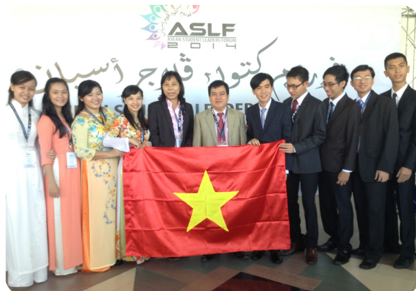
Tham dự diễn đàn Thủ lĩnh sinh viên tại Brunei.