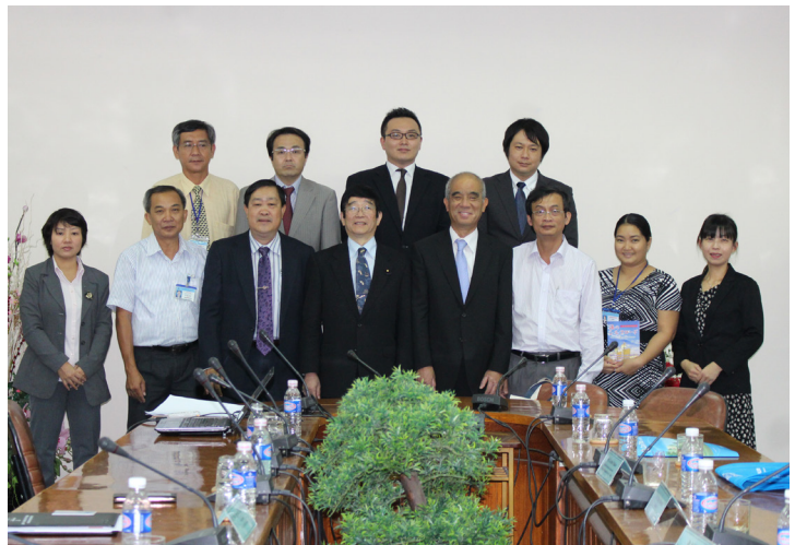
Ảnh lưu niệm tại buổi làm việc với đoàn công tác.

Về hợp tác giữa Trường ĐHTC với Trường Đại học Nagasaki, hai bên sẽ tiếp tục thảo luận, thực hiện các hoạt động giao lưu, trao đổi học thuật, hợp tác nghiên cứu tại các trung tâm nghiên cứu của hai trường, đặc biệt là tạo điều kiện phát triển đội ngũ giảng viên, nghiên cứu viên trẻ, đội ngũ kế thừa trong tương lai.