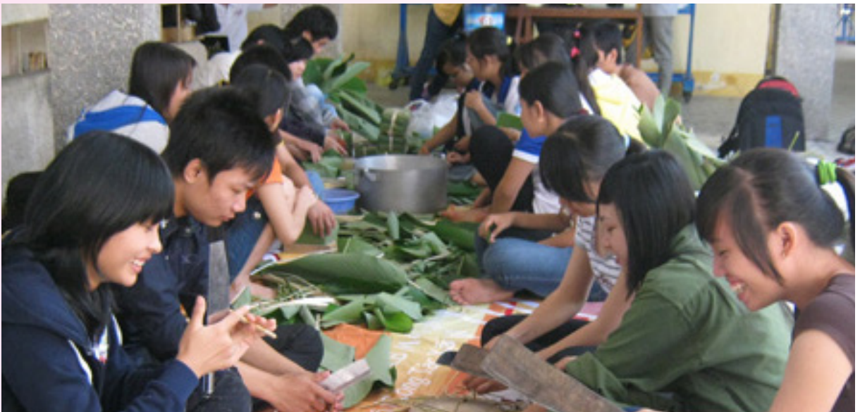
Niềm vui ngày Tết - Ảnh minh họa.