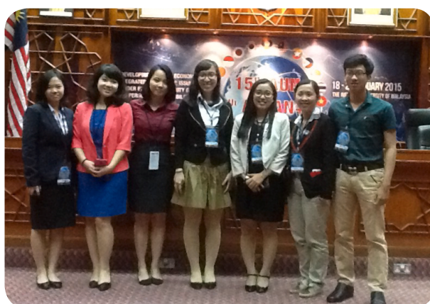
Dự diễn đàn văn hóa và thi hùng biện sinh viên tại Malaysia.

5. Đại hội Đại biểu Đoàn TNCS Hồ Chí Minh (2014-2017): đã bầu chọn được ban chấp hành gồm 33 cán bộ Đoàn, đoàn viên tiêu biểu quyết tâm đồng hành cùng đoàn viên thanh niên nhà trường thực hiện Nghị quyết đại hội đã đề ra với mục tiêu “ Tuổi trẻ Đại học Cần Thơ nâng cao hiệu quả công tác giáo dục, phong trào thanh niên tình nguyện và giao lưu hội nhập ”.