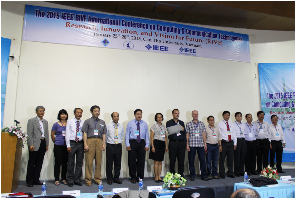
Ảnh lưu niệm tại Hội thảo IEEE-RIVF 2015.

Từ ngày 25/01-28/01/2015, Trường Đại học Cần Thơ (ĐHCT) đã đăng cai tổ chức Hội thảo quốc tế về công nghệ thông tin và truyền thông IEEE-RIVF 2015 (The 2015 IEEE RIVF International Conference on Computing & Communication Technologies-Research, Innovation, and Vision for Future). Hội thảo quy tụ khoảng 100 nhà khoa học đến từ 37 đơn vị là các viện, trường trong nước và 11 quốc gia khác trên thế giới.