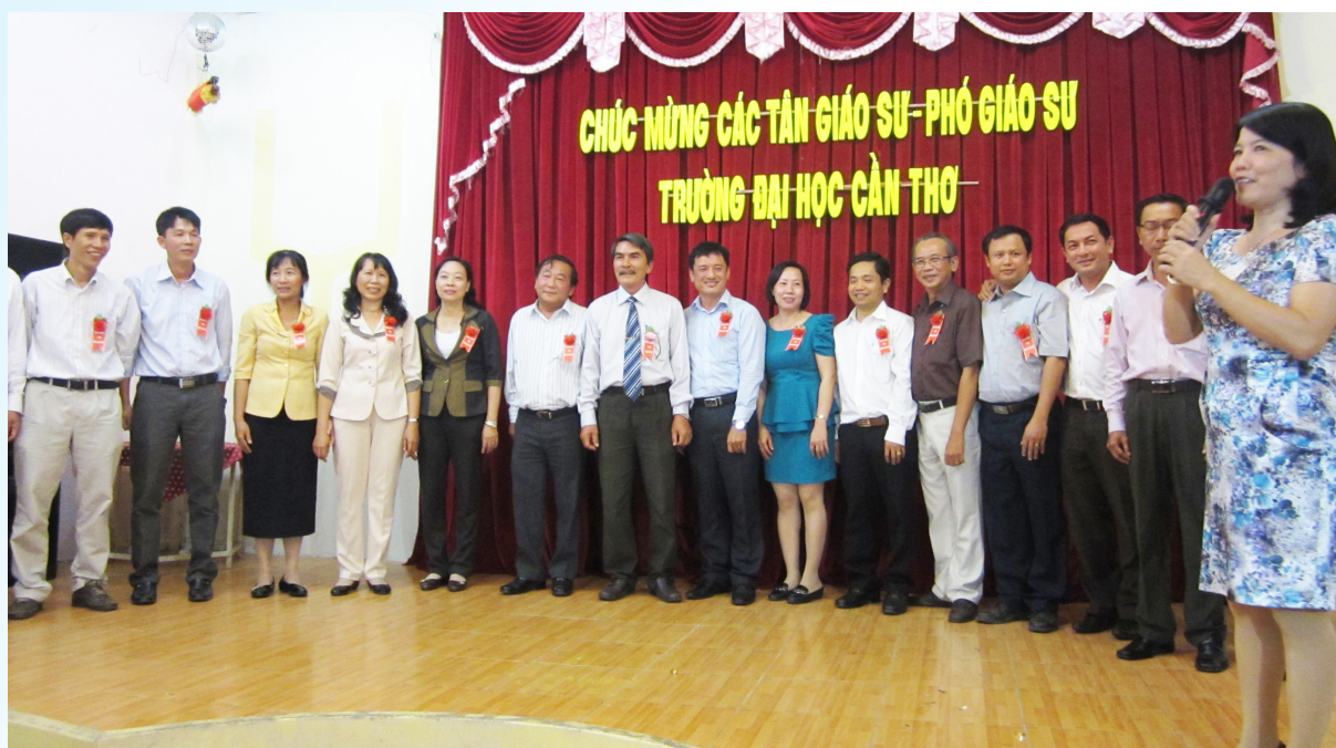
Trường ĐHCT tổ chức buổi lễ chúc mừng các tân Giáo sư, Phó Giáo sư năm 2014.

Như vậy, Trường ĐHCT hiện có 101 GS và PGS, trong đó có 08 GS và 93 PGS. Nhà trường hy vọng đội ngũ GS, PGS của Trường sẽ mang hết trí tuệ và tâm huyết của mình để đi đầu trong sự nghiệp giáo dục-đào tạo, nghiên cứu khoa học và đưa Trường ĐHCT phát triển lên một tầm cao mới.