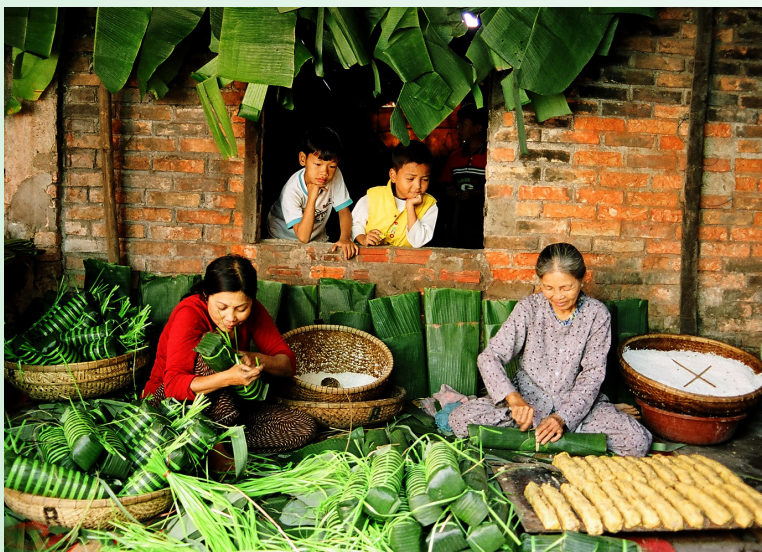
Bánh tét ngày Tết - Ảnh minh họa.

Buổi tối, mẹ ngồi tính tính đếm đếm bên cuốn sổ ghi chép thu chi trong nhà, nhìn nét mặt mẹ, tôi cũng hiểu đôi phần. Những đợt thờ dài làm đũa con gái lớn như tôi bỗng cảm thấy mình vô dụng quá. Hơn hai mươi, vậy mà còn sách vở học hành, rồi hoạt động này nọ, bạn bè thế kia. Trong khi những đũa ở cùng xóm đã đi làm kiếm tiền phụ gia đình được mấy năm rồi. Năm nào cũng vậy, mỗi dịp gần Tết, mẹ tôi đều ước nó đến muộn hơn một chút nữa, cho mẹ kịp chuẩn bị cái này cho con, cái nọ cho chồng.