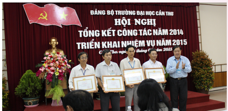
Trao bằng khen cho các tập thể và cá nhân đạt thành tích tốt trong năm 2014.

Tại Hội nghị, Đảng ủy Trường đã tiến hành khen thưởng các tập thể và cá nhân đạt thành tích tốt trong năm 2014: khen thưởng 04 tổ chức cơ sở Đảng; 03 chi bộ trực thuộc đảng bộ cơ sở; 61 đảng viên tiêu biểu; 16 tổ chức cơ sở Đảng hoạt động hiệu quả theo chuyên đề.