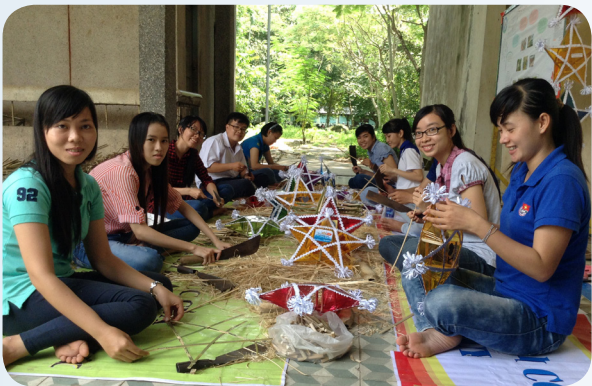
Hoạt động Trung thu cho trẻ em nghèo huy động hơn 350 triệu đồng.