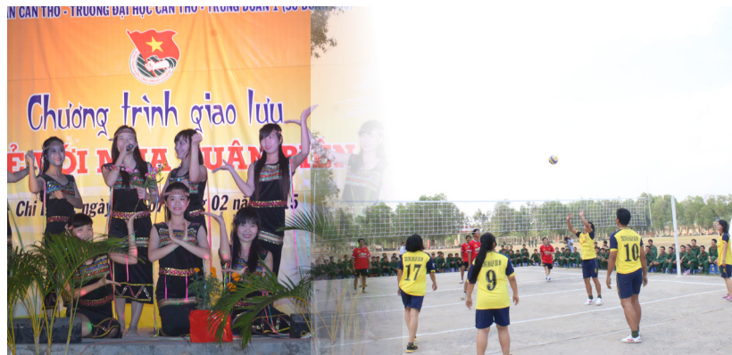
Giao lưu văn nghệ và thể thao với các chiến sĩ.

Trong buổi gặp gỡ ấm tình quân dân với các đơn vị, lãnh đạo Trường ĐHCT cũng vui mừng chia sẻ về hoạt động của Trường, về những kết quả đạt được và định hướng hoạt động của Trường trong thời gian tới. Lãnh đạo Trường nhấn mạnh ý nghĩa của hoạt động truyền thống giao lưu, kết nghĩa giữa nhà trường với các đơn vị, đã giúp các em sinh viên hiểu được đời sống của cán bộ, chiến sĩ; qua đó giáo dục tinh thần yêu nước, ý thức tự lực tự cường và truyền thống cách mạng của dân tộc, nâng cao ý thức và tinh thần trách nhiệm của thế hệ trẻ đối với sự nghiệp xây dựng và bảo vệ Tổ quốc.