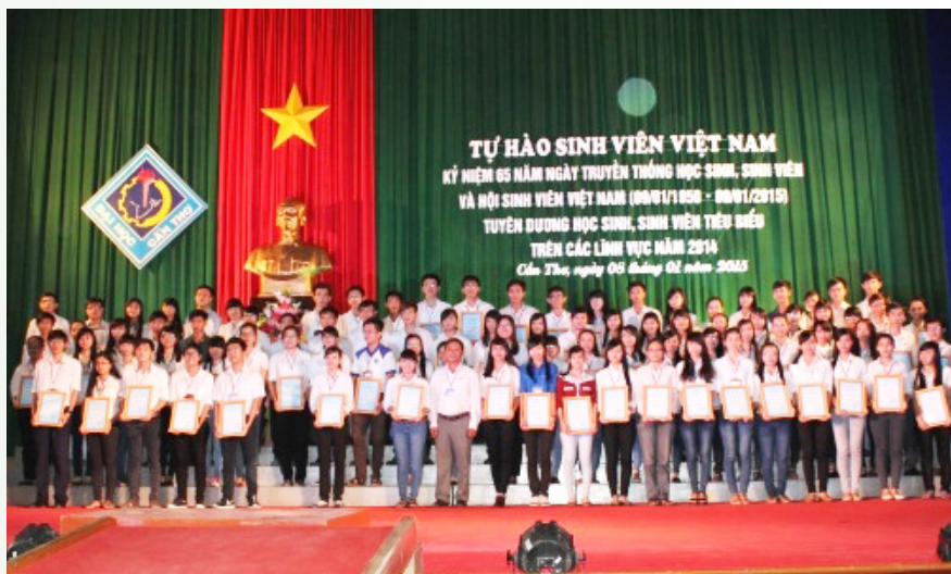
Ảnh lưu niệm tại Chương trình họp mặt “Tự hào sinh viên Việt Nam”.

Chương trình họp mặt “ Tự hào sinh viên Việt Nam ” được tổ chức lồng ghép với nhiều nội dung xoay quanh việc ôn lại truyền thống yêu nước của học sinh, sinh viên Việt Nam và tổ chức Hội sinh viên, giáo dục Hội viên-sinh viên về truyền thống và lịch sử của Hội. Chương trình đã trao 25 suất học bổng Yamaha Hồng Phúc cho các bạn sinh viên có hoàn cảnh khó khăn, tuyên dương 299 sinh viên đạt danh hiệu “ Sinh viên 5 tốt ” các cấp, 107 sinh viên tiêu biểu trên các lĩnh vực có thành tích xuất sắc trong các hoạt động phong trào văn hóa văn nghệ-thể dục thể thao năm 2014.