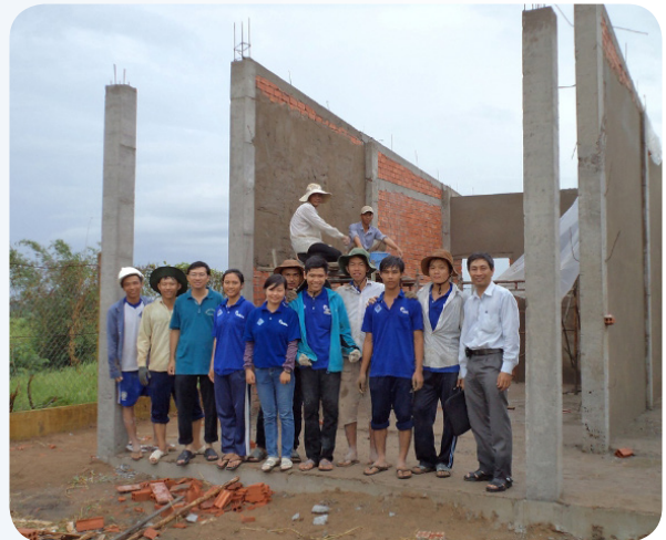
Chiến dịch Thanh niên tình nguyện hè tại 11/13 tỉnh/thành Đồng bằng sông Cửu Long, hơn 2.000 sinh viên tham gia xây dựng nông thôn mới, chuyển giao khoa học kỹ thuật với tổng kinh phí thực hiện 2,15 tỷ đồng.