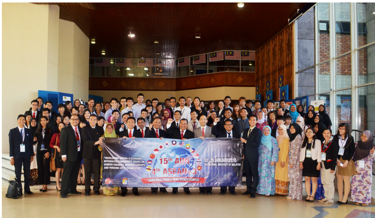
Ảnh lưu niệm tại Diễn đàn giáo dục AUN thứ 15 và khối ASEAN+3 lần thứ 4.

của mình, chia sẻ những kinh nghiệm đúc kết được từ thực tiễn của mỗi nước về chủ đề chính của chương trình, tầm quan trọng của việc đem lại bình đẳng và nhiều quyền lợi hơn cho các nhóm yếu thế trong xã hội.