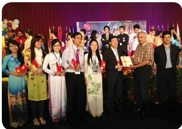
Giao lưu văn hóa tại Malaysia.