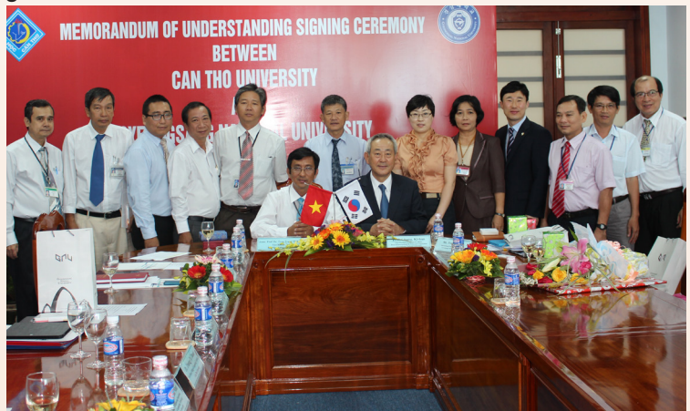
Ảnh lưu niệm tại buổi lễ ký kết hợp tác.