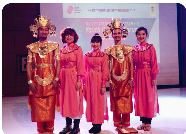
Tham dự diễn đàn văn hóa, nghệ thuật truyền thống tại Indonesia.